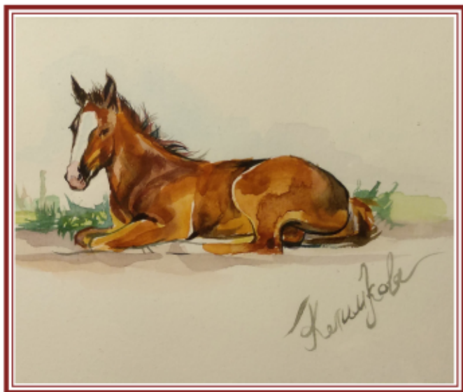
СОФЬЯ КЛИМКОВА «ЖЕРЕБЕНОК» акварель, 2017 г.

«Люблю детей и свою профессию. Участие в выставке – это для меня новый формат работы, интересный и творческий.»