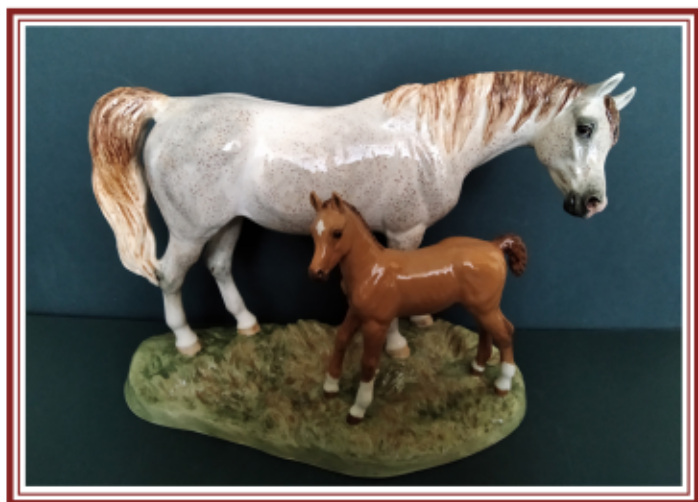
КОЧЕТКОВА Н.М. «АРАБСКАЯ КОБЫЛА С ЖЕРЕБЁНКОМ» фаянс, 17х13х20 см, 02.2020 г.

«Занимаясь анималистической скульптурой, стараюсь показать красоту, пластику животного и моё безмерное восхищение живой природой».