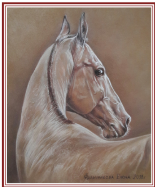
ФИЛЬЧЕНКОВА ЕЛЕНА «АХАЛТЕКИНЕЦ» 30x40 см, сухая пастель, 2018 г.

Неоднократное проведение персональных выставок на Краснодарском ипподроме. Картинами награждены победители значимых скачек. Партнер ежегодного детского параолимпийского турнира.