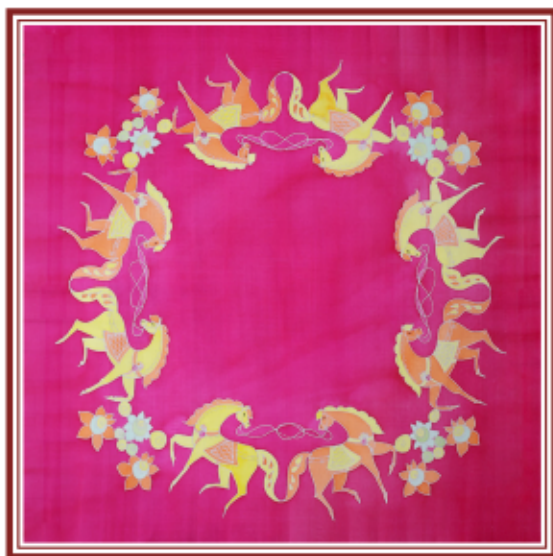
ЕКАТЕРИНА ЗАБЕГИНА “ЛЕТО В ГОРОДЦЕ” шелк, анилиновые красители 90x90 см, 2011 г.

Творческий девиз автора и слоган бренда – «Любовь, счастье, лошади».