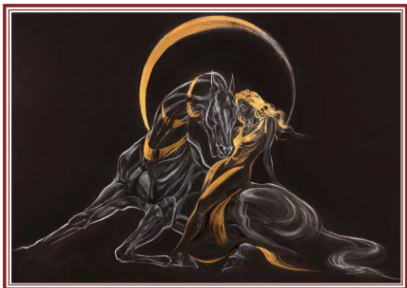
ЛЮБОВЬ МИЩЕНКО «НОЧНОЕ СОЛНЦЕ»

«Лошадь-это мой способ выразить себя в искусстве!»