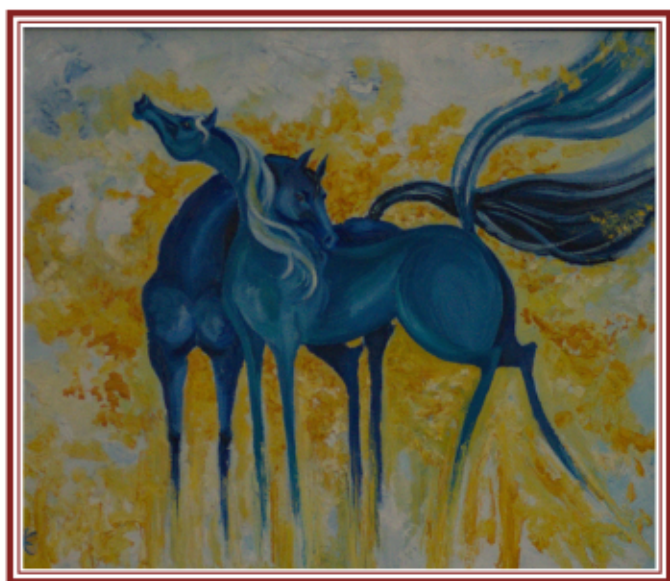
КАРИНЭ ВОСКАНЯНЦ «ЛЮБОВЬ» масло, 2019 г.

«Творить из состояния гармонии и изобилия, ведь картина, попадая в новый дом должна излучать тепло и любовь».